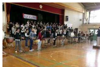
6年生 小学校最後の音楽会—迫力ある演奏！