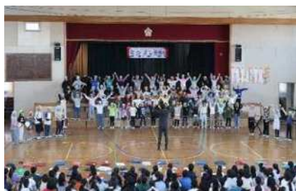
2年生 心ウキウキ～サンバのリズム♪

早いもので年内の登校日数も17日となりました。交通指導員、防犯ボランティアの皆様、保護者の皆様には、児童の安全な登下校を見守っていただきありがとうございました。本年の学校教育活動への多くの御協力に改めて感謝いたします。よいお年をお迎えください。