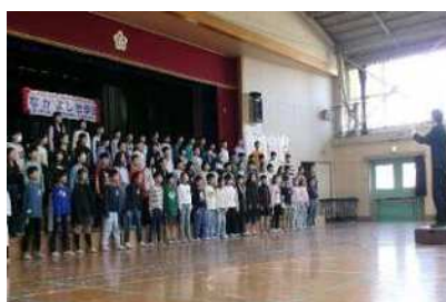
4年生 市小・中合同音楽会に代表参加