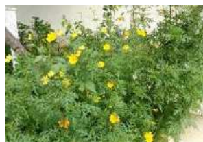
↑ 校舎西側に咲くキバナコスモス

在籍児童数 525名、通常18学級、特別支援2学級、全20学級 教職員数54名（10月1日現在）