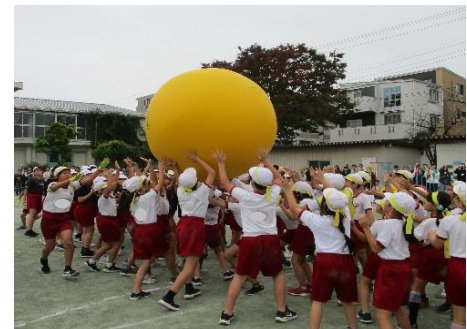
全校種目：一致団結大玉送り

この運動会の目標は「日頃の体育学習の成果を、自主的・創造的に楽しく発表する。」です。開会式の話で「本領発揮」という言葉を児童に紹介しました。本領発揮の意味は「自分の持っている能力や持ち味などを、存分に出すこと」です。この「本領」を発揮できるかどうかは、児童の気持ちが受動的か、能動的かが大きく影響すると考えています。開会式のエール交換では、応援団の児童を中心に、低学年から高学年までが一体となって応援に取り組む姿に、大牧小の児童の素晴らしさをあらためて感じることができました。各学年の団体競技や表現種目では、限られた時間の練習過程において、様々な困難を乗り越えた一人ひとりの頑張りとともに、集団としての高まりも伝わってきました。また、高学年の児童が、係の自分の役割を真剣に果たす姿が見られ頼もしさを感じました。皆が「本領発揮」の運動会、児童の心に強く残る行事となりました。