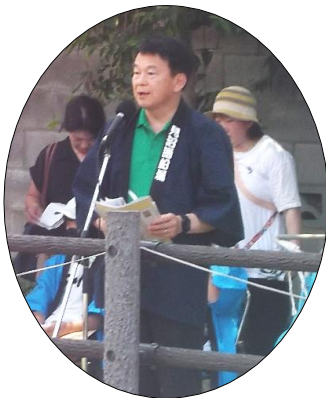
挨拶する清水市長