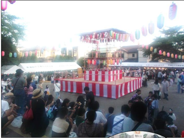
東浦和6丁目 (8月3・4日) 子ども達もお手伝い