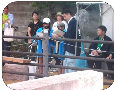
指示を出す子ども代表