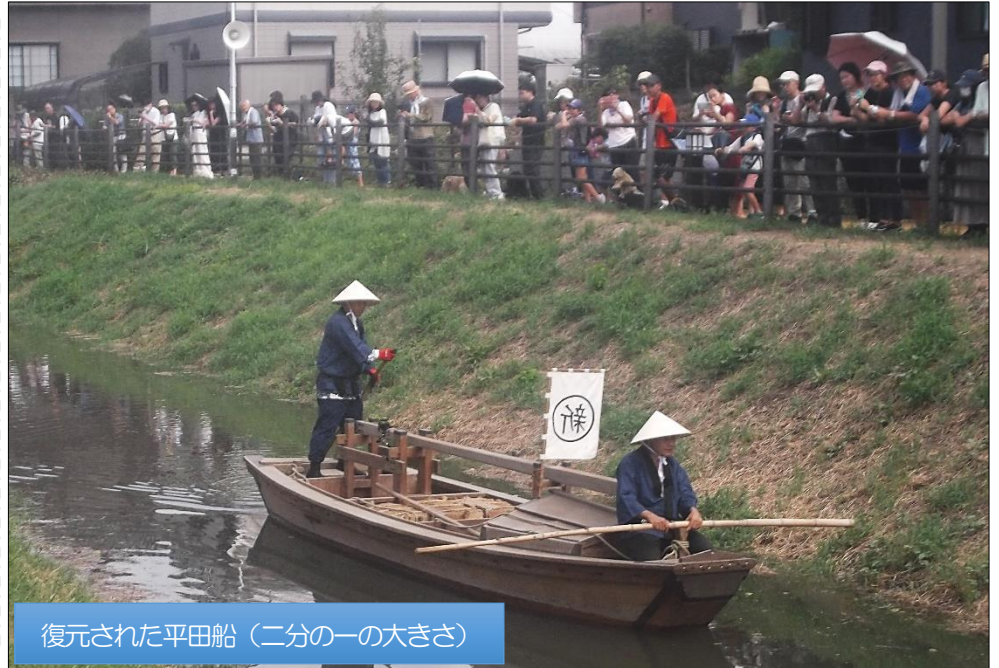
復元された平田船 (二分の一の大きさ)

8月21日(水)、10時と13時の2回、通船堀の閘門の開閉実演が行われました。地域の子も代表の指示により、一ノ関の閘門が閉められ、水位が上がったところで復元船が航行されました。