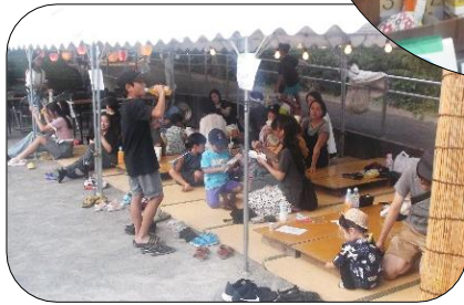
家族での参加も多く、また、ゴミの回収を手伝う子どもの姿もありました。