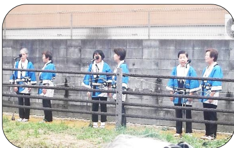
見沼通船舟歌保存会の歌と踊り