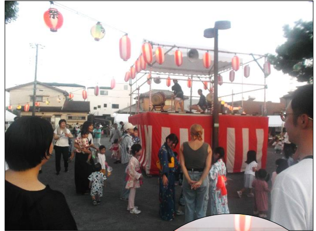
東浦和7丁目 (8月17日) 見沼太鼓で盆踊り